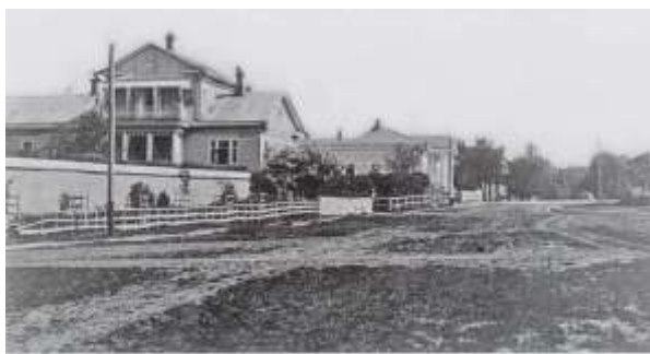
Вид с Красной (бывшей Соборной) площади на дома по ул. Интернациональной (бывшей Гостиной)