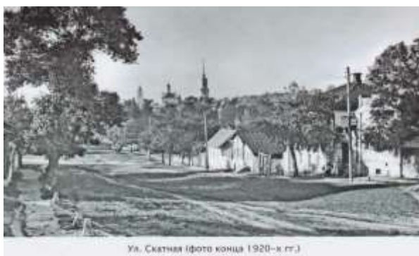
Ул. Скатная (фото конца 1920-х гг.)

Гостиная улица, названная так по гостиным дворам, расположенным на ней, а также Продольная, получившая имя по своему положению вдоль двух предыдущих улиц и Монастырская. В этой местности располагаются любители тишины.