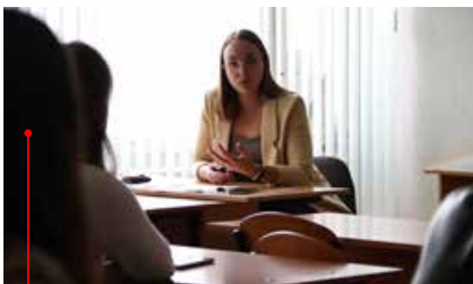
Тренинг по бережливому производству от представителя АО «Индезит Интернэшнл»