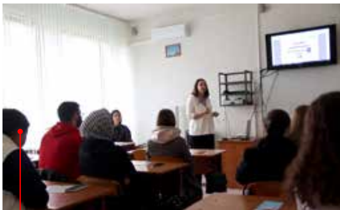
Тренинг «От резюме до собеседования» от экспертов Центра занятости населения Липецкой области