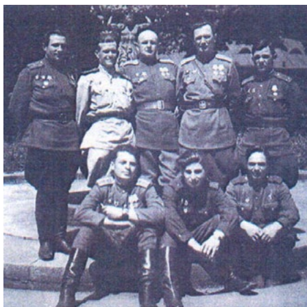
С боевыми товарищами

подбила их и на какое-то время закрыла дорогу. Немцы, не выходя из укрытий, вели по нам ураганный огонь из всех видов оружия. Мы несли большие потери. Загорелись наши машины: американские студебекеры. Я дал команду оставшимся машинам развернуться, погрузить раненых и отходить. Мы отходили, отстреливаясь из автоматов, и достигли городка. Штаб корпуса к этому времени успел эвакуироваться. Вскоре подошли войска, с которыми мы соединились. Нам выдали технику, пополнили новыми орудиями. В 2 часа дня уже в составе всей нашей группировки, которую возглавлял лично командующий армией Дмитрий Данилович Лелюшенко, мы начали операцию по разгрому.