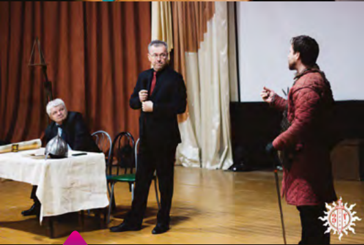
Студенты проводят время не только весело, но и с пользой