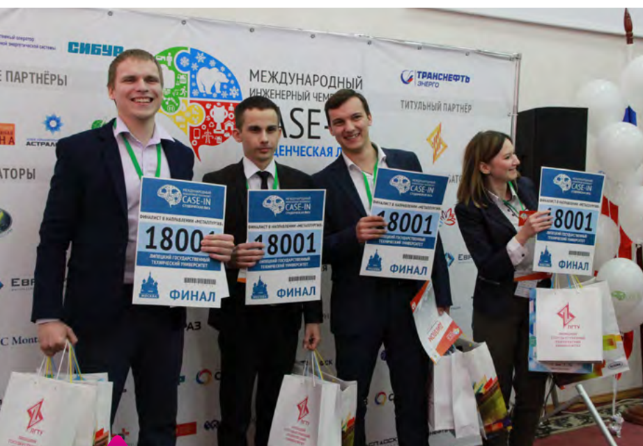
Команда «Инновация» – победитель отборочного этапа

В Липецком государственном техническом университете 21 февраля состоялась торжественная церемония открытия и региональный отборочный этап Лиги металлургии международного инженерного чемпионата «Case-in» — крупнейшего практико-ориентированного соревнования в России и странах СНГ по решению инженерных кейсов среди студентов и аспирантов вузов.