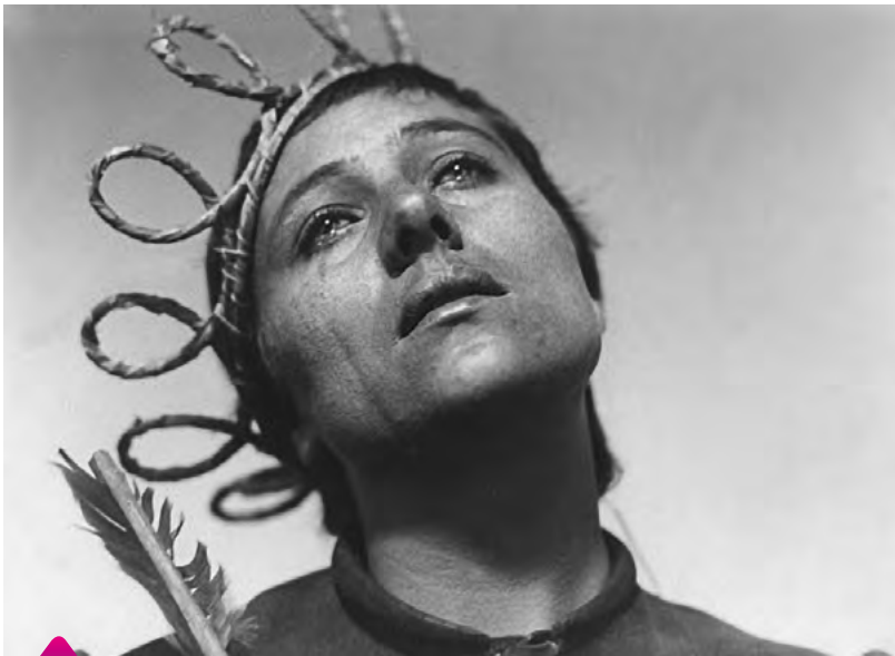
Кадр из фильма «Страсти Жанны д'Арк» (1928 г.)